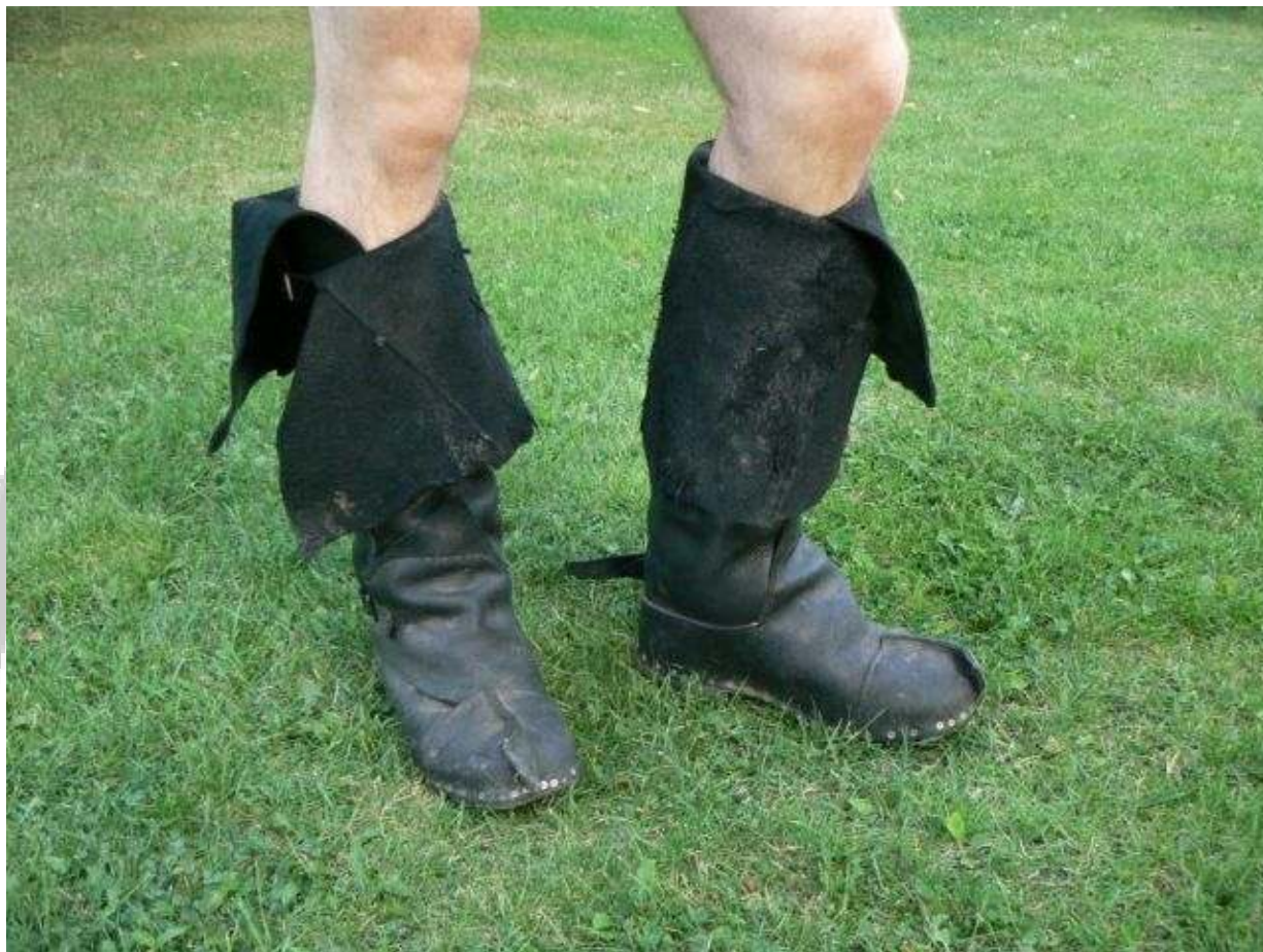
Skřetí ohrnovačky se zapínáním na kožený řemen.

přišroubujeme z boku k tlusté podrážce starých pohor/kanad. Vruty by od sebe neměly být dál než 15mm (vzdálenost os vrutů). Důležitý je vhodný střih (abychom se díky zapínání „pseudoškorně“ dostali i k zavazování kanad či pohor) a dostatečná rezerva kůže v místech, kde se přišroubovává kůže k podrážce (přesný rozměr se špatně odhaduje a nastavovat se tu moc nedá). Je lepší použít silnější kůži – více vydrží.