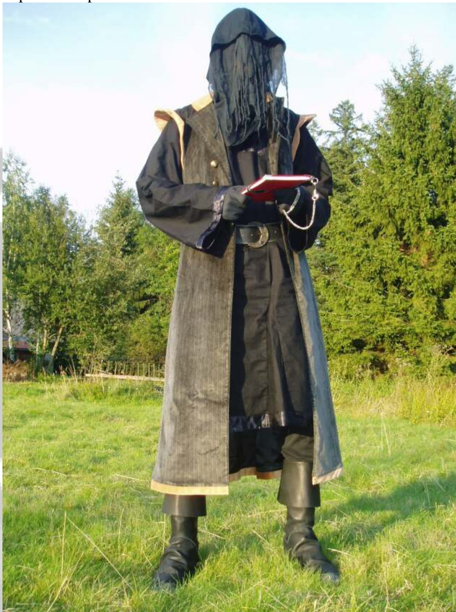
Vojenské kanady překryté pseudoškorněmi