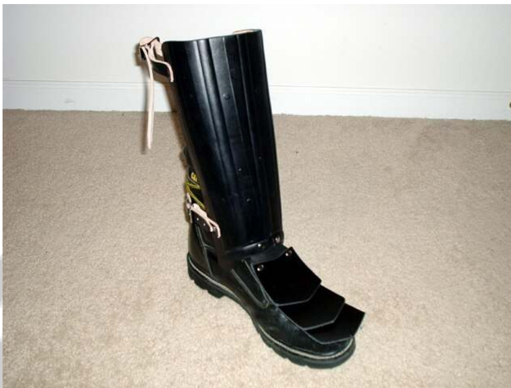
Copak je pod chráničem za botu??:-)