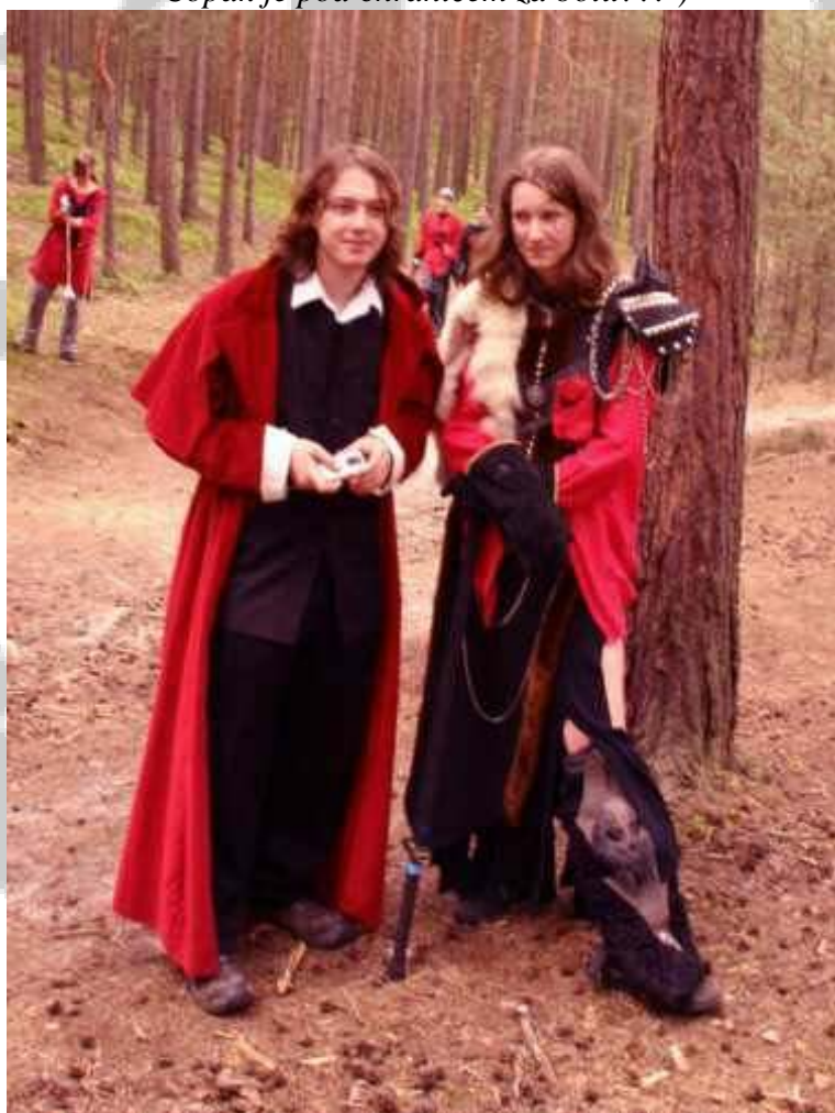
Povšimněte si toho co má slečna (to je ta vpravo J ) na své levé noze....