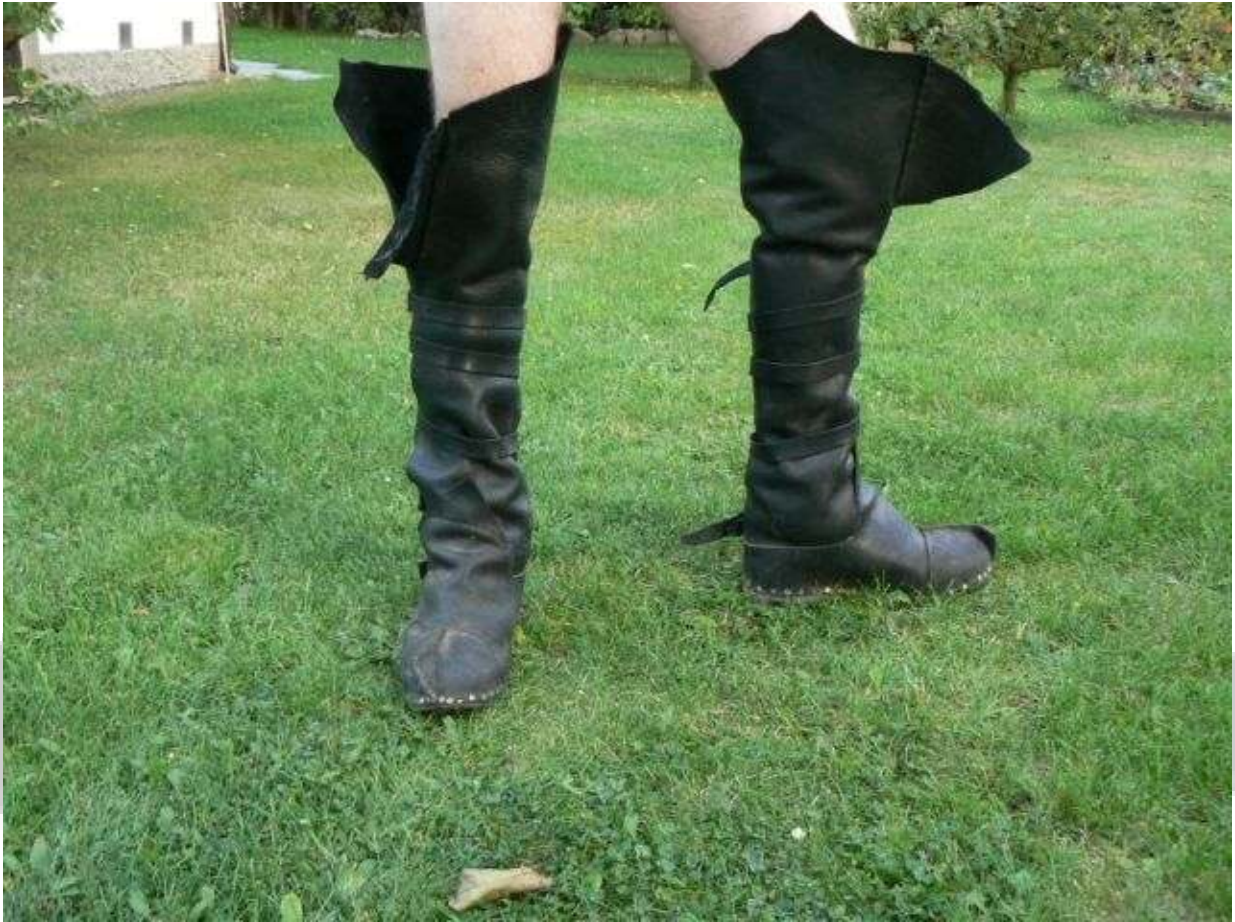
Vyhrnuté boty (na fotografii botám ještě chybí horní přezka nad kolenem)